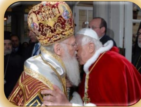
Il-Papa Benedittu XVI jiltaqa' mal-Patrijarka Ortodoss Bartilmew I