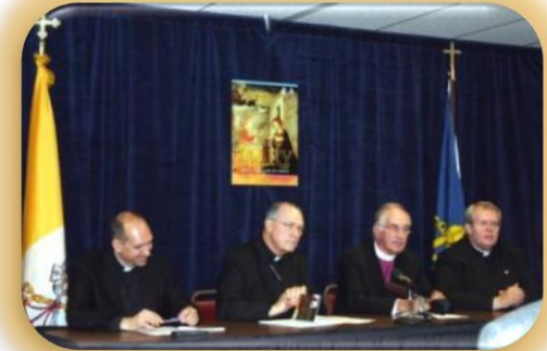
Laqgħa bejn studjużi Kattoliċi u Anglikani (ARCIC)